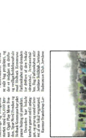
Et nyt udendørs fitness-område er blevet indviet på Kildebjergskolen i Holbæk. Området er et samarbejde mellem skolen og kommunen, og det er et godt eksempel på, hvordan man kan skabe et sundt og aktivt miljø for eleverne.

Et nyt udendørs fitness-område er blevet indviet på Kildebjergskolen i Holbæk. Området er et samarbejde mellem skolen og kommunen, og det er et godt eksempel på, hvordan man kan skabe et sundt og aktivt miljø for eleverne. Et nyt udendørs fitness-område er blevet indviet på Kildebjergskolen i Holbæk. Området er et samarbejde mellem skolen og kommunen, og det er et godt eksempel på, hvordan man kan skabe et sundt og aktivt miljø for eleverne.