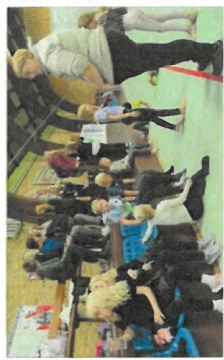
Skolebørn og forældre tog over undervisningen i klasseværelset på Kildebjergskolen i Holbæk i dag. Billedet viser eleverne og deres forældre, der har været med til at undervise børnene i matematik og dansk.

Skolebørn og forældre tog over undervisningen i klasseværelset på Kildebjergskolen i Holbæk i dag. Billedet viser eleverne og deres forældre, der har været med til at undervise børnene i matematik og dansk. Skolebørn og forældre tog over undervisningen i klasseværelset på Kildebjergskolen i Holbæk i dag. Billedet viser eleverne og deres forældre, der har været med til at undervise børnene i matematik og dansk.