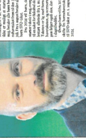
Skolestart-forsøget på Kildebjergskolen i Holbæk har fået politisk opbakning fra kommunestyret. Forsøget er et samarbejde mellem skolen og kommunen, og det er et godt eksempel på, hvordan man kan skabe et sundt og aktivt miljø for eleverne.

Skolestart-forsøget på Kildebjergskolen i Holbæk har fået politisk opbakning fra kommunestyret. Forsøget er et samarbejde mellem skolen og kommunen, og det er et godt eksempel på, hvordan man kan skabe et sundt og aktivt miljø for eleverne. Skolestart-forsøget på Kildebjergskolen i Holbæk har fået politisk opbakning fra kommunestyret. Forsøget er et samarbejde mellem skolen og kommunen, og det er et godt eksempel på, hvordan man kan skabe et sundt og aktivt miljø for eleverne.