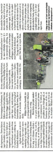
Skolestarten på Kildebjergskolen i Holbæk bliver organiseret på børnenes præmisser. Dette betyder, at eleverne har indflydelse på, hvordan skolestarten foregår, og det er et godt eksempel på, hvordan man kan skabe et sundt og aktivt miljø for eleverne.

Skolestarten på Kildebjergskolen i Holbæk bliver organiseret på børnenes præmisser. Dette betyder, at eleverne har indflydelse på, hvordan skolestarten foregår, og det er et godt eksempel på, hvordan man kan skabe et sundt og aktivt miljø for eleverne. Skolestarten på Kildebjergskolen i Holbæk bliver organiseret på børnenes præmisser. Dette betyder, at eleverne har indflydelse på, hvordan skolestarten foregår, og det er et godt eksempel på, hvordan man kan skabe et sundt og aktivt miljø for eleverne.